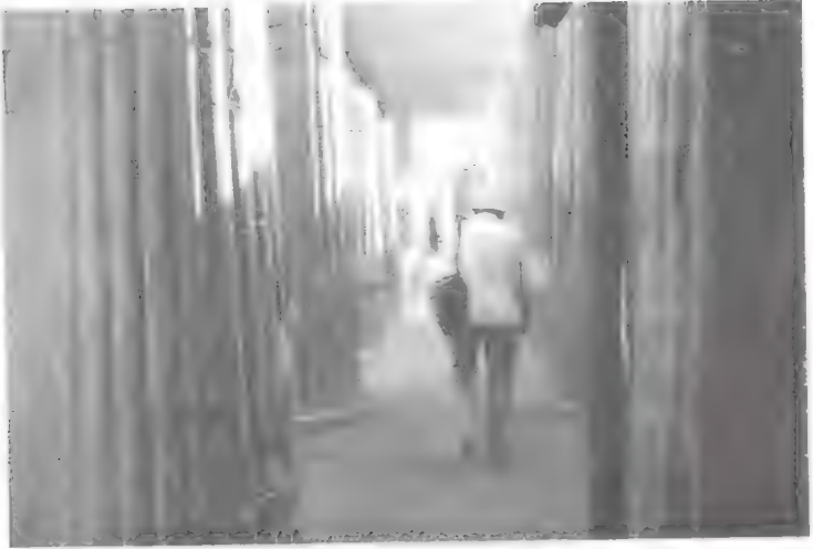
لوير داخل دهليز المدخل الذي رممه